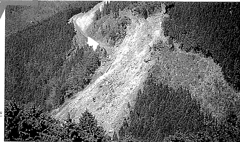
工事用道路上より発生した地すべり