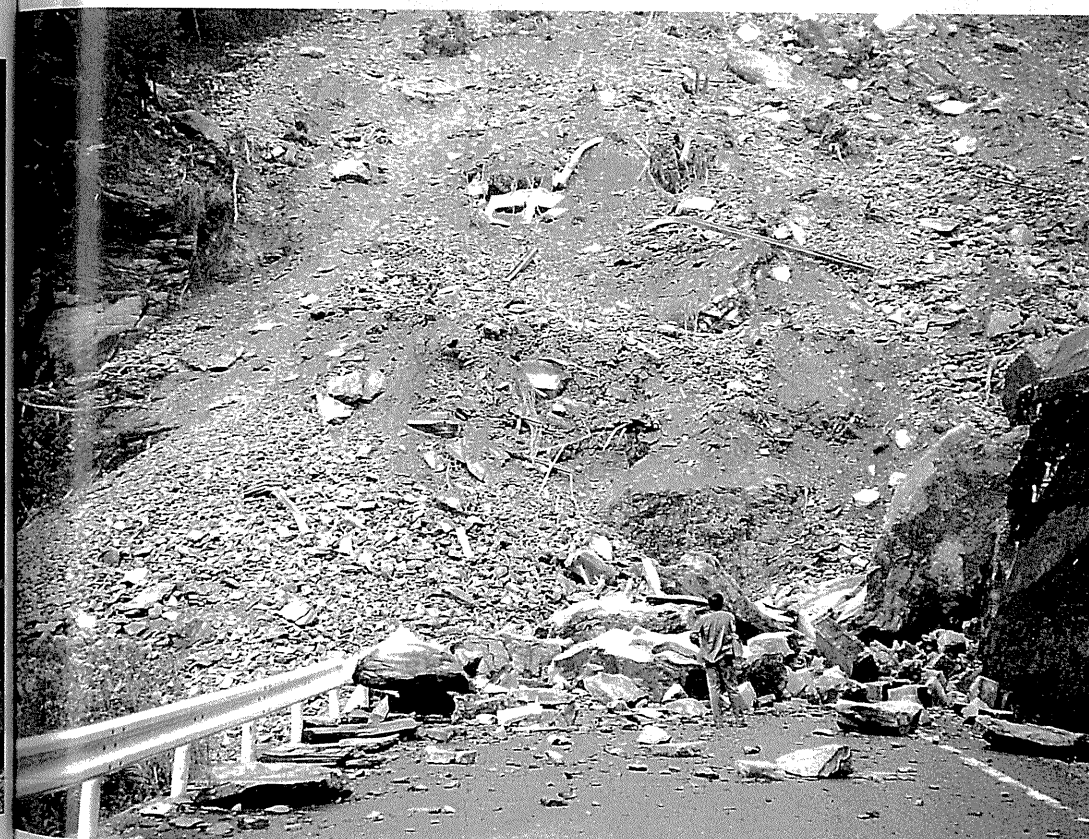
寸断された国道194号