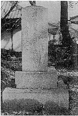
洪水犠牲者の供養塔(伊舎那院内)