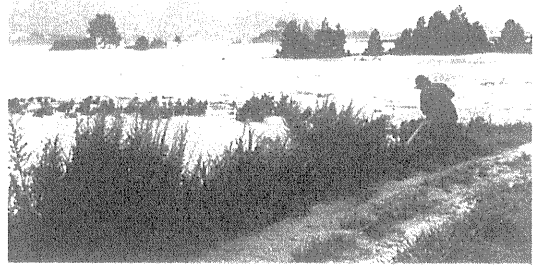
吉野川の洪水の爪跡

九月十七日枕崎台風。岩津における流量毎秒、一万四七〇〇立方メートルを記録。流量改定及び堤防第二期改修の契機となった。