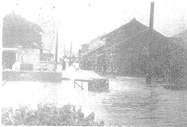
大洪水に浸された江川崎

二十八日夕方から強い風が加わり、雨も激しくいよいよ暴風雨となった。正午を過ぎる頃からの雨はいわゆる盆を覆すごとく、風も又激しさを加え、吉野川・四万十川は刻々増水し川沿の桑畑は浸水しはじめた。川崎商店街もようやく荷揚げにとりかかった。二階のある家は二階へ、平屋の家は近所の高いところの家に連んだ。川崎小学校も道路より六尺余高い。それで学校は大丈夫と、附近の人々が荷物を運びこんだ。四時頃には道路まで浸水した。風は少し衰え