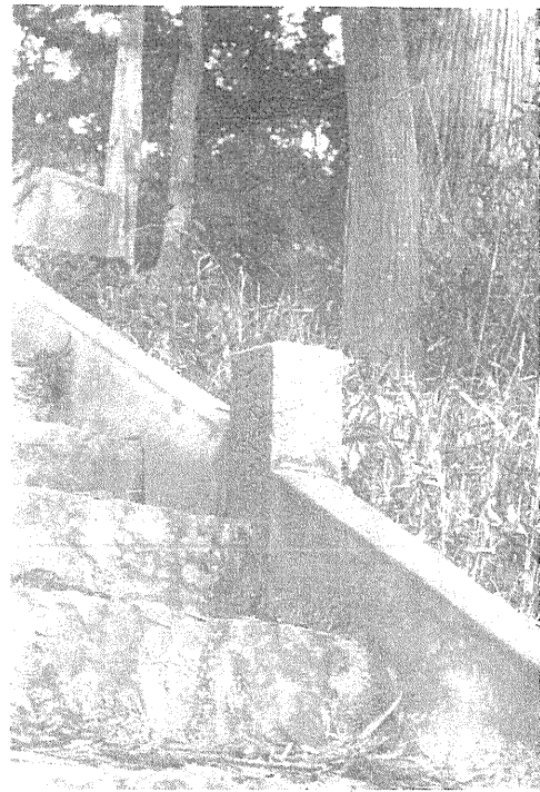
明治23年洪水標(口屋内鷺神社)

明治十九年から五年目、二十三年九月九日から十一日にかけて暴風強雨であったが、十九年のそれが強風であつたに對し、二十三年のそれは豪雨であり、古今稀にみる大洪水となった。田畑の流失、稲作の被害、橋梁流失等随分な損害を蒙つた。中村町附近の四万十川水位は十九年の時平水より二丈九尺五寸(約九メートル)高く、二十三年の場合これよりさらに二尺(約六十四センチ)高かつたのである。わずかに六十センチといつても水流全域にわたつての六十センチであるから水量からいえば大したものであることを想像しなければならぬ。